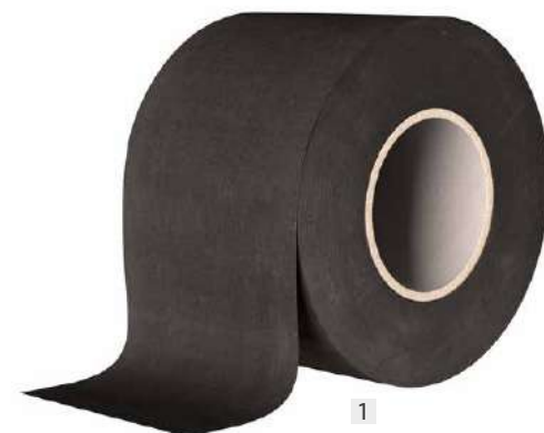
1 START BAND