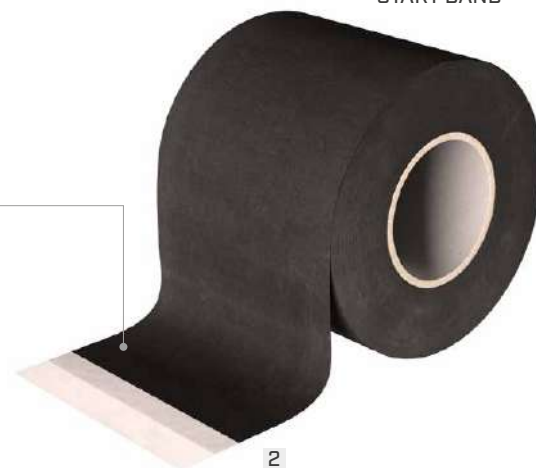
2 START BAND ADHESIVE