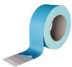
DOUBLE BAND pag. 62