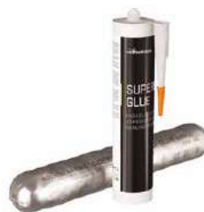
SUPERB GLUE pag. 150