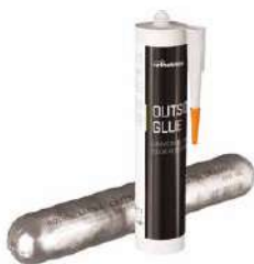
OUTSIDE GLUE pag. 154