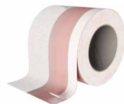
PLASTER BAND LITE