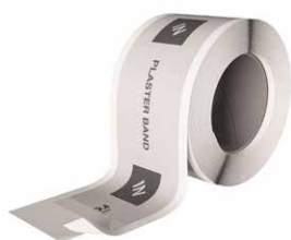
PLASTER BAND IN